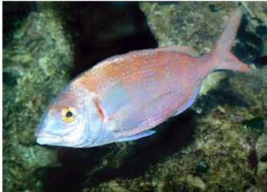
Slika 2. Arbun rumenac, Pagellus erythrinus

Protoginični je hermafrodit, do otprilike treće godine jedinke su ženke, a kasnije mužjaci. Mrijesti se potkraj proljeća i početkom ljeta. Hrani se pretežno polihetima, školjkašima, racima i ribom. Arbun rumenac rasprostranjen je na području istočnog Atlantika (od Skandinavije do Kapverdskih otoka) i Mediterana. U Jadranskom moru je posvuda rasprostranjen (Jardas, 1996).