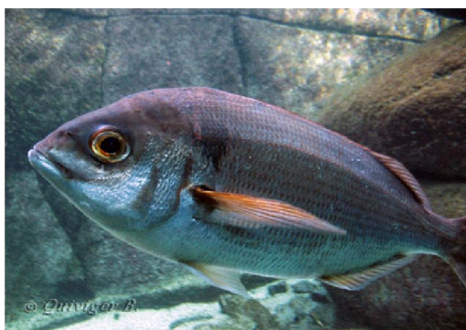
Slika 3. Rumenac okan, Pagellus bogaraveo

Rumenac okan, Pagellus bogaraveo ima tijelo koje je u profilu ovalno, a bočno blago spljošteno. Leđa su smečkasto do sivkastoružičaste boje, a bokovi su svijetlo do bjelkastosrebrni (Slika 3). Na početku bočne pruge postoji veća crna mrlja. U prosjeku naraste do 60 cm i 5 kg. Obitava u priobalnom području, iznad različitih dna (stijene, pijesak, mulj), do 700 m dubine. Zadržava se u plovama i proteandrični je hermafrodit. Mrijesti se potkraj jeseni i početkom zime. Hrani se sitnim pelagičnim beskralježnjacima, ribljom ikrom i ribljom mlađi. Rasprostranjen je na području istočnog Atlantika (od Skandinavije do rta Blanc) te u srednjem i zapadnom Mediteranu. U Jadranskom moru rumenac okan je relativno rijetka vrsta. (Jardas, 1996).