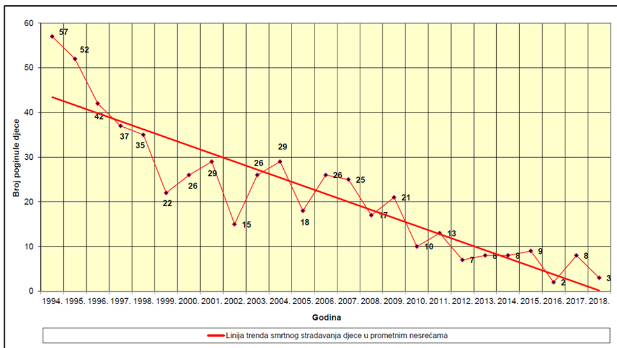
Slika 4. Smrtno stradala djeca u prometnim nesrećama od 1994. do 2018.

Edukacija je ključni element ove akcije, a provodi se kroz različite aktivnosti, uključujući predavanja policijskih službenika u osnovnim školama. Učenici prvih razreda redovito sudjeluju u edukacijskim programima gdje ih se podučava temeljnim pravilima sigurnog sudjelovanja u prometu. Kroz interaktivne radionice, predavanja i razgovore, djeca uče o važnosti pravilnog prelaska ceste, korištenju pješačkih prijelaza, kao i o sigurnosnim mjerama poput nošenja reflektirajuće odjeće. Ova vrsta neposredne edukacije ima dugoročne učinke jer djeca kroz rane interakcije s policajcima razvijaju svijest o prometnim pravilima koja će ih pratiti tijekom cijelog života. Smatra se da je ova akcija, između ostalog, dovela do smanjenja smrtnosti djece u prometu u Republici Hrvatskoj (slika 4.).