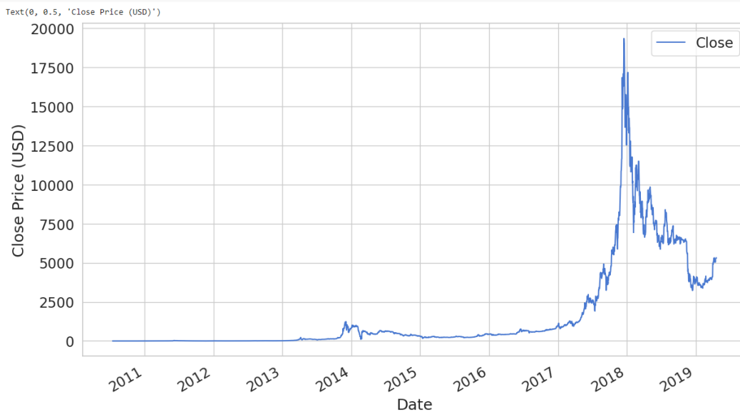
Grafikon 1. Prikaz cijena Bitcoina

[7] ax = df.plot(x='Date', y='Close'); ax.set_xlabel("Date") ax.set_ylabel("Close Price (USD)")