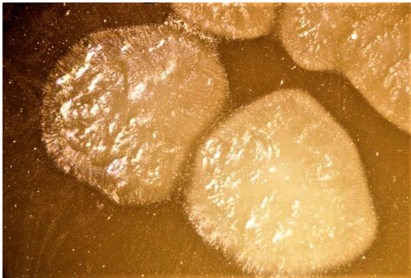
Slika 2. Kolonijalna morfologija C. botulinum na agaru žumanjka

Na konjskom krvnom agaru, svi sojevi osim onih koji pripadaju tipu G su \beta -hemolitični. Na agaru žumanjka, sojevi osim G-tipa sojeva imaju biserni efekt i proizvode opalescenciju.[3]