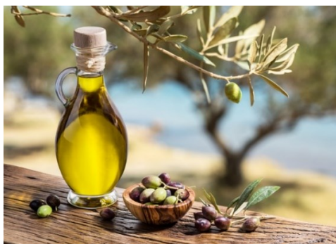
Slika 6. Ekstra djevičansko maslinovo ulje