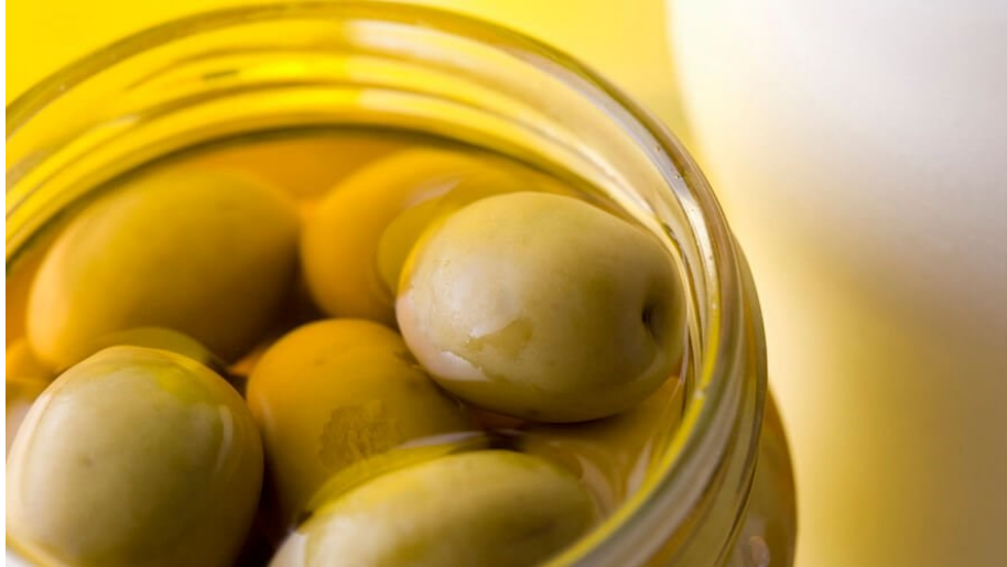
Slika 7. Konzervirane masline za jelo