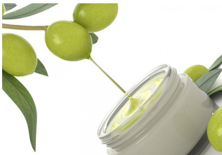
Slika 8. Kozmetički preparat od maslinova ulja

Zbog navedenog, visokokvalitetno ekstra djevičansko maslinovo ulje koristi se kao dodatak mnogim kremama, uljima i mlijeku za tijelo, u svrhu sprječavanja oštećenja te prijevremenog starenja kože. Vrlo često je korišteno u hranjivim maskama za lice i kosu (Miljković i sur., 2011). Ključni je sastojak u raznim sapunima, kremama, losionima, šamponima i drugim kozmetičkim proizvodima (Slika 8). Također, može se koristiti i za vlaženje i njegu suhe kože i ispucalih usana, za jačanje slabih i lomljivih noktiju, obnavljanje i uljepšavanje kose i vlasišta. Stoga je alternativa komercijalnoj kozmetici koja obiluje sintetičkim dodacima i kao takva često oštećuje kožu, ostavljajući je suhom i nadraženom. Maslinovo ulje hidrira i čisti kožu, a ujedno uravnotežuje proizvodnju prirodnih ulja u koži što joj daje blistavost (web 23).