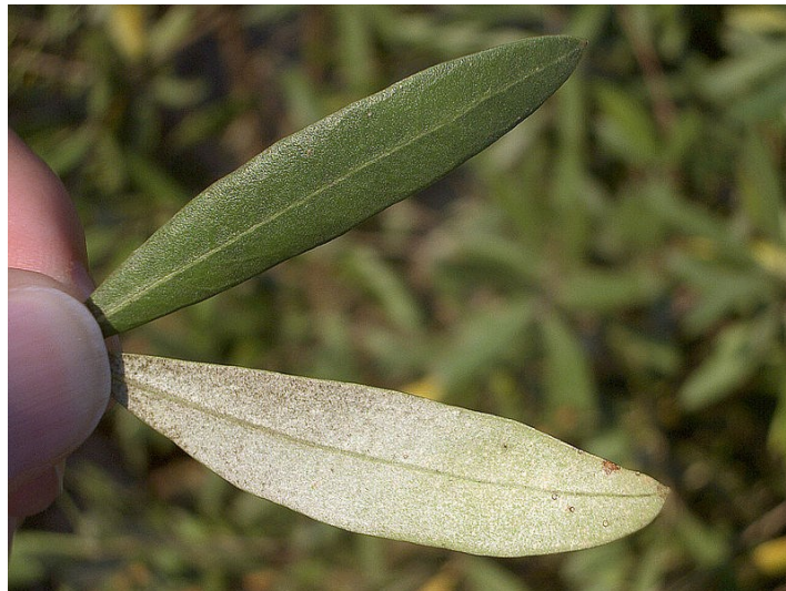
Slika 4. List masline, lice i naličje

List masline (Slika 4) sastoji se od lisne plojke, peteljke i drške. Ima lice i naličje, odnosno dorziventralno je građen. Primarna funkcija lista je fotosinteza koja se odvija u mezofilu lista. Ovisno o kojoj se sorti masline radi, list je različitog oblika, boje, veličine i nazubljenosti. Kožnat je te sadrži veliki broj puči na naličju. Osim puči, epiderma lista tvori i zvjezdaste mrtve dlake, ispunjene zrakom i bijele boje koje biljku štite od isušivanja, smanjuju transpiraciju i reflektiraju sunčeve zrake (Miljković i sur., 2011).