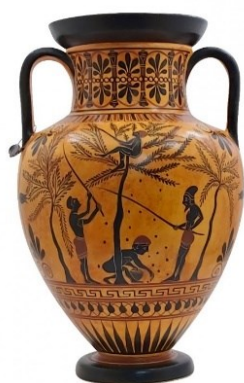
Slika 1. Grčka amfora s motivom berbe maslina

Rezultati analize drveta i koštica masline iz Vranjica pored Splita, potvrđuju da se zeleni plod masline u Hrvatskoj konzumirao već u prapovijesno doba. Učvršćivanjem rimske vladavine, maslinarstvo se raširilo na području Dalmacije i od tada teče njegov ubrzani razvoj (Bakarić i sur., 2007).