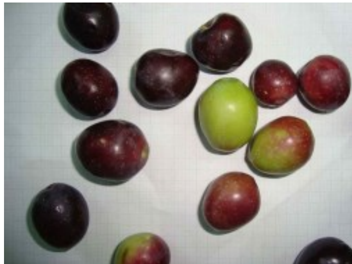
Slika 3. Plod oblice

Oblicu karakterizira dvojaka namjena. Plod se može prerađivati u ulje, ali i konzervirati zbog svoje veličine. Sadržaj ulja u plodu je 18-21 % što uvelike ovisi o uzgojnim uvjetima i godišnjim agrotehničkim prilikama (web 5).