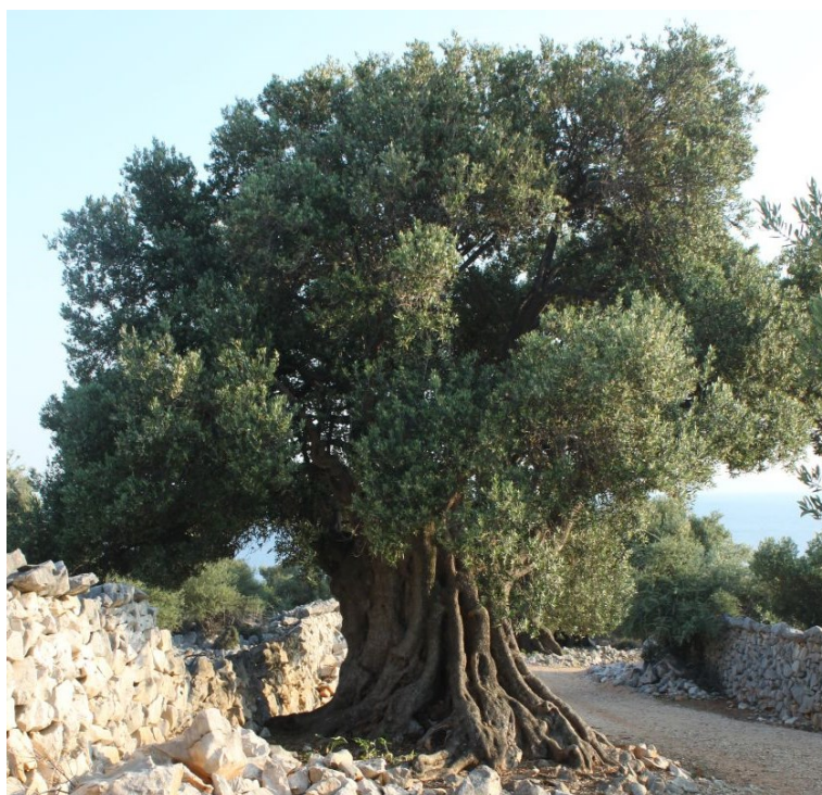
Slika 2. Stablo masline

NARODNA IMENA: maslina, maslica, uljika, uljenka, zelenka, zelenica, obljica, ponturica, merčakinja, želudarica, uljenasta maslina (Nikolić, 2013)