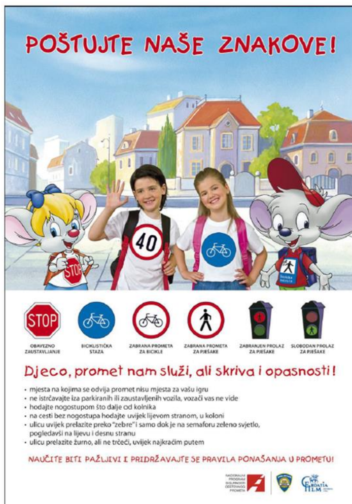
Slika 3. Akcija „Poštuj naše znakove“

Akcija „Poštujte naše znakove“ u Hrvatskoj (slika 3.) predstavlja primjer izuzetno uspješne preventivne inicijative koja kombinira edukativne i represivne mjere s ciljem povećanja sigurnosti djece u prometu. Ova akcija, pokrenuta od strane Ministarstva unutarnjih poslova, provodi se od 1995. godine i usmjerena je na podizanje svijesti među vozačima o potrebi pažljivog i odgovornog ponašanja u prometu, osobito u blizini škola i drugih mjesta gdje se djeca često kreću. Provodi se u sklopu Nacionalnog programa sigurnosti cestovnog prometa (Bajić, 2008).