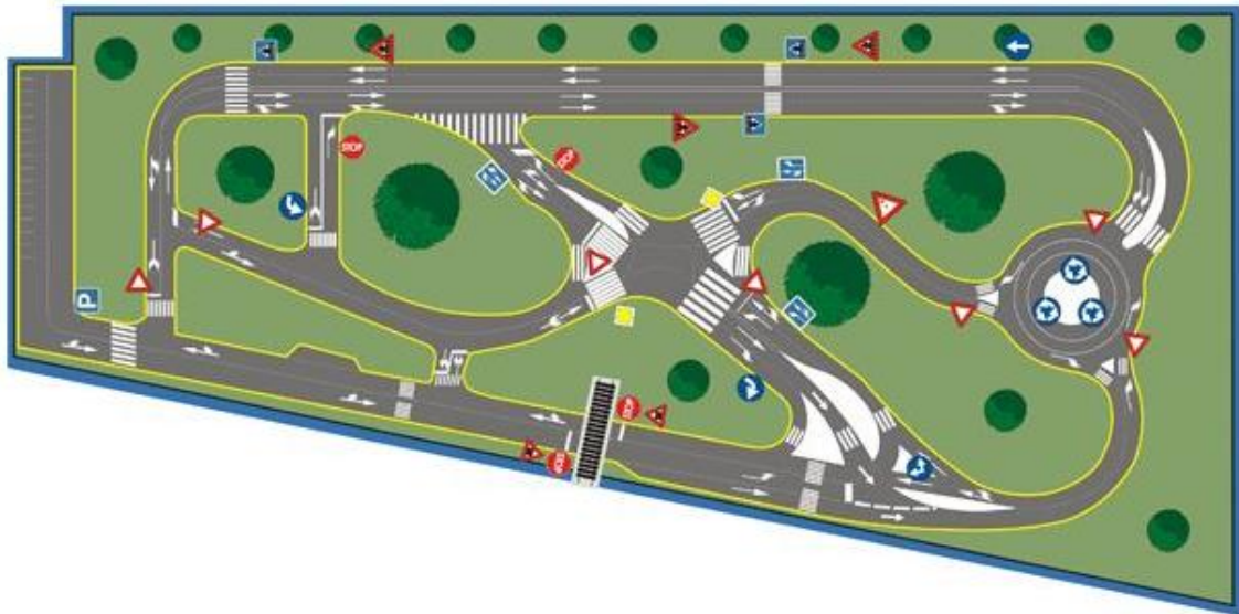
Slika 6. Školski prometni poligon Auto kluba „Split“

poligonu, gdje djeca kao pješaci i biciklisti primjenjuju stečena znanja o prometnoj kulturi i propisima u sigurnom i realističnom okruženju.