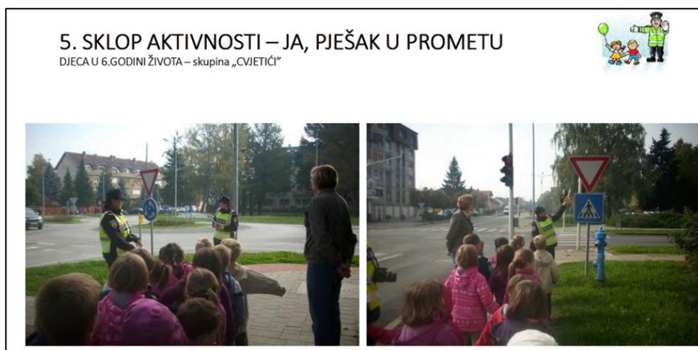
Slika 5. Akcija s HAK-om dječjeg vrtića Tratinčica

Vrtić „Tratinčica“ je također uveo prometni poligon, koji je iscrtavan na asfaltiranim površinama u vrtićkim dvorištima. Djeca kroz svakodnevne aktivnosti na poligonu vježbaju sigurno kretanje u prometu, prepoznavanje prometnih znakova te pravilno ponašanje kao pješaci i biciklisti. Ova metoda praktične edukacije ključna je jer djeci pruža priliku da u sigurnom i kontroliranom okruženju primijene ono što su naučila kroz teorijsku nastavu. Poligon je oblikovan prema standardima Hrvatske auto-moto udruge (HAK), što osigurava njegovu relevantnost i učinkovitost (slika 5.)