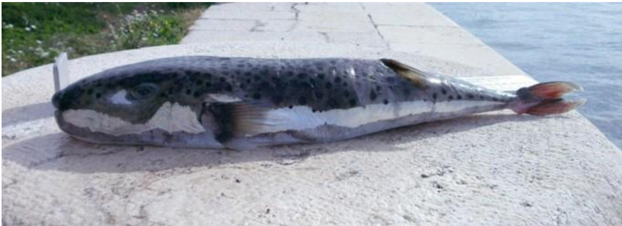
Slika 4. Srebrenopruga napuhača ( Lagocephalus sceleratus ) ulovljena 2013. godine kod Tribunja

Srebrenopruga napuhača tropska je vrsta porijeklom iz Indijskog i zapadnog dijela Tihog oceana. U Jadranskom moru je prvi put zabilježena 2012. godine kod otoka Jakljana. Konzumacija ove ribe izazva zdravstvene probleme i smrt kao posljedicu trovanja tetradotoksinom. Tetradotoksin pripada neurotoksinima i 1250 puta je jači od cijanida. Srebrenopruga napuhača je predatorska vrsta i napada gospodarski važne vrste (Dragičević i sur., 2020.; Dragović, 2022.).