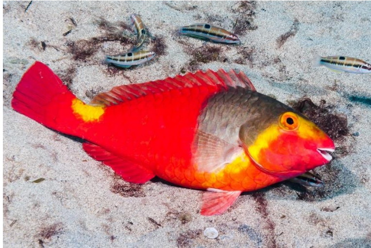
Slika 11. Papigača ( Sparisoma cretense )