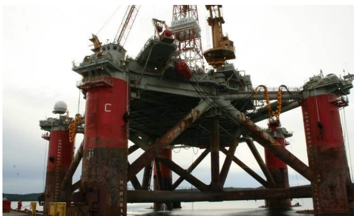
Slika 17. Naftna platforma u brodogradilištu u Trogiru

Naftne platforme koje su godinama uronjene u more te se prevoze iz jednog u drugo more omogućavaju prijenos pojedinih vrsta. Primjer je naftna platforma koja je 2011. godine dotegljena iz Meksičkog zaljeva kojom su prenesene jedinke vrste kreolske vučice ( Paranthias furcifer ) (Valenciennes, 1828) i kraljičinog anđelka ( Holacanthus ciliaris ) (Linnaeus, 1758). Pretpostavlja se da su preživjele pronalazeći skrovišta u podvodnim džepovima u strukturi platforme (Dragičević i sur., 2020.).