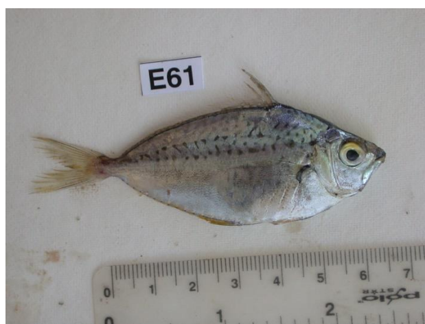
Slika 7. Sapunar ( Equulites (Leiognathus) klunzingeri )

Sapunar pripada porodici Leiognathidae i rasprostranjena je u Crvenom i Sredozemnom moru. Obitava na kontinentalnom šelfu u blizini obale do 70 m dubine. Prehrana joj se sastoji od bentonskih beskralježnjaka. U Jadranskom moru je prvi put zabilježena 2000. godine na Mljetu u uvali Saplunara. Ulovljena je na dubini od 4 m pomoću mreže potegače na pjeskovitom dnu. Nakon ovog zapisa više nije viđena u Jadranskom moru (Dulčić i Dragičević, 2011.).