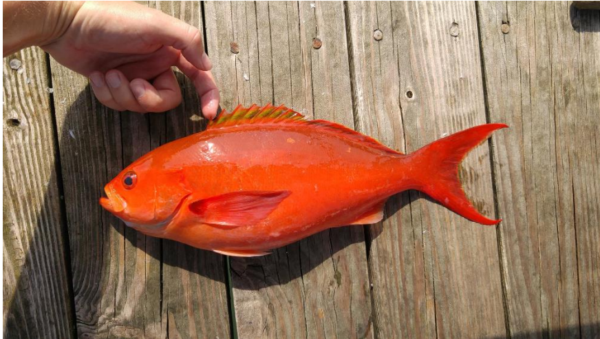
Slika 18. Kreolska vučica ( Paranthias furcifer )