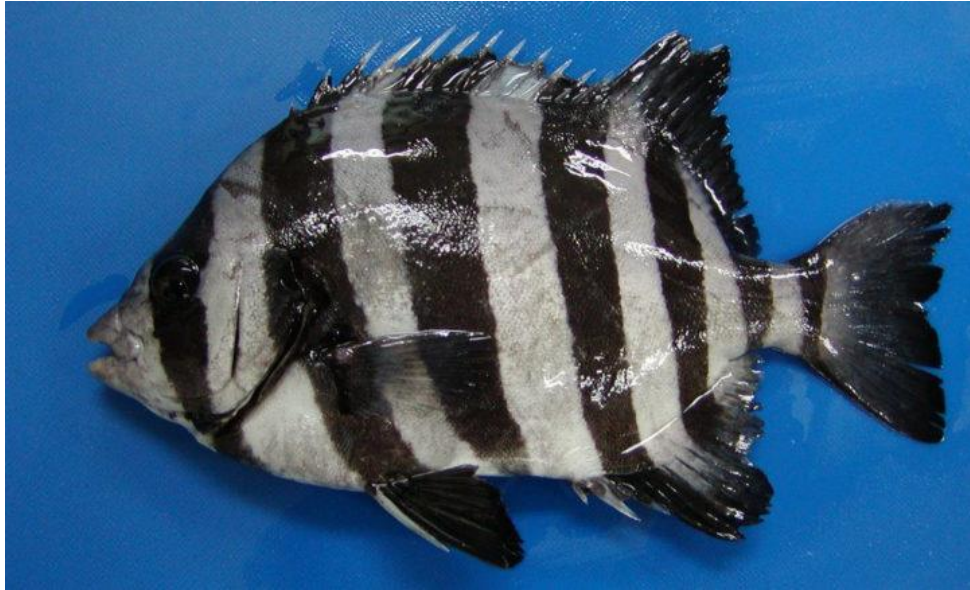
Slika 14. Prugasti kljunaš ( Oplegnathus fasciatus )