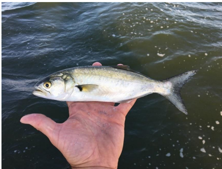
Slika 10. Strijelka skakuša ( Pomatomus saltatrix )

jedan od mogućih načina je lov u većim količinama i uvođenje u gastronomiju (Dulčić i Dragičević, 2011.; Dulčić i sur., 2005.).