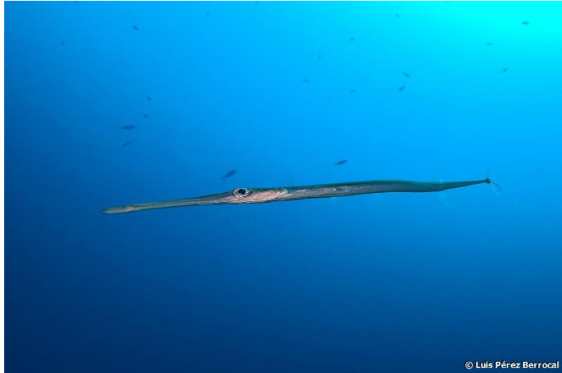
Slika 3. Plavotočkasta trumpetača ( Fistularia commersonii )