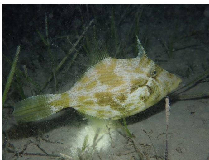
Slika 8. Afrički kostorog ( Stephanolepis diaspros )

Vrsta afrički kostorog pripada porodici Monacanthidae i rasprostranjena je u zapadnom dijelu Indijskog oceana, u Perzijskom zaljevu i Crvenom moru. Vrsta je prisutna na dubinama od 20 do 50 m te na kamenitim dnima koji obiluju vegetacijom. Njezina prehrana sastoji se od malih bentonskih beskralješnjaka. U Jadranskom moru je zabilježena samo jednom 2002. godine uz crnogorsku obalu. Zabilježeni primjerak pronađen je na ribarnici u Ulcinju, a prema navodima ribara s tog područja vrsta je uhvaćena plivaricom na 20 m dubine kod hridi Djeran (Dulčić i Dragičević, 2011.; Dulčić i Pallaoro, 2003.).