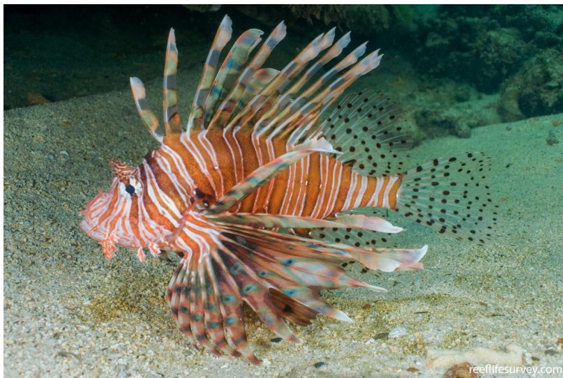
Slika 5. Morski paun ( Pterois volitans )

Alohtona je vrsta koja se hrani velikim količinama sitne ribe i rakovima. P. volitans je prirodno rasprostranjena u zapadnom i središnjem Pacifiku do zapadne Australije. Zbog nedostatka prirodnih predatora u vodama Jadranskog mora ova vrsta se može razmnožavati velikom brzinom čemu doprinosi i činjenica da zrele ženke polažu 50 tisuća jaja svaka tri dana. Morski paun predstavlja opasnost za zdravlje ljudi zbog neurotoksina koji ispunjava stanice koje se nalaze na završecima njezinih bodlji (Dragović, 2022.). Najveća su opasnost za ravnotežu hranidbenog lanca u morskom ekosustavu jer su izraziti grabežljivci na manjim, ribolovnim vrstama riba te predstavljaju i socioekonomsku opasnost (Dulčić i Kovačić, 2020).