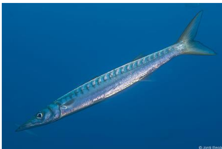
Slika 9. Žutousna barakuda ( Sphyraena viridensis )