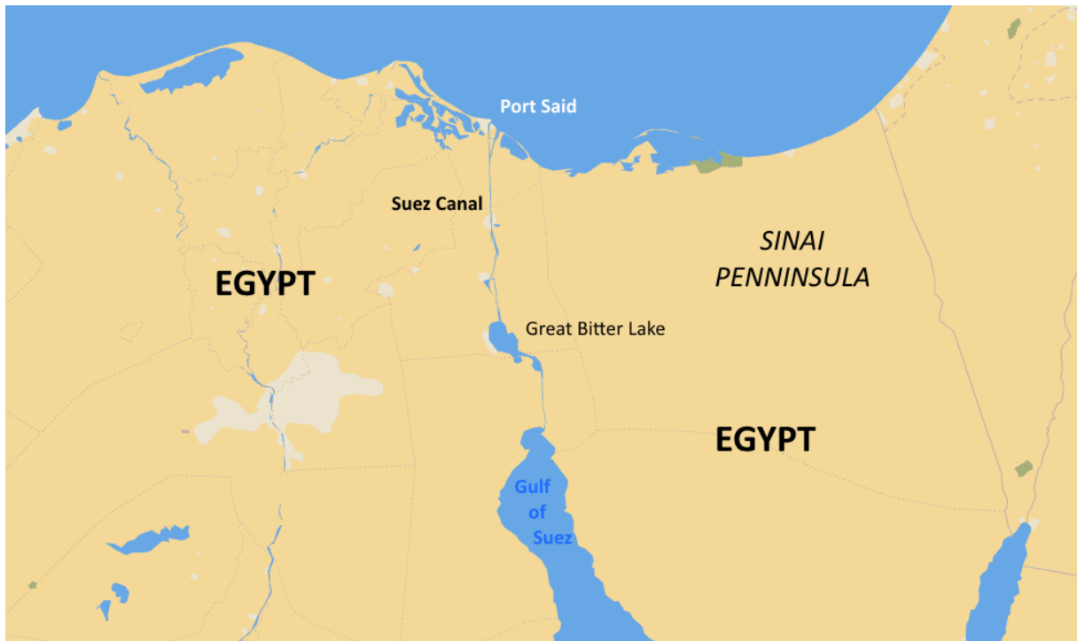
Slika 2. Prikaz geografskog položaja Sueskog kanala