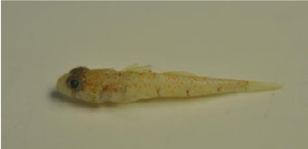
Slika 12. Buenia massutii (Autor: Marcelo Kovačić) (izvor: https://www.menorca.info/menorca/vivir-menorca/2017/04/26/1540676/descubren-nueva-especie-pez-menorca.html )