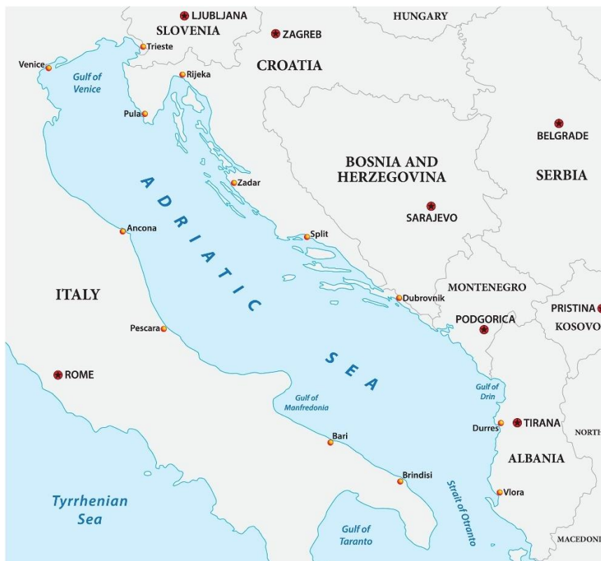
Slika 1. Geografski položaj Jadranskog mora

Cilj ovog rada je opisati čimbenike koji su doveli do unosa stranih i invazivnih vrsta riba u Jadransko more, utvrditi posljedice na autohtonu ihtiofaunu te navesti zabilježene nove strane i invazivne vrste.