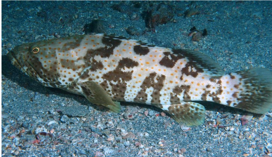
Slika 15. Narančasto-pjegasta kirnja ( Epinephelus coioides )