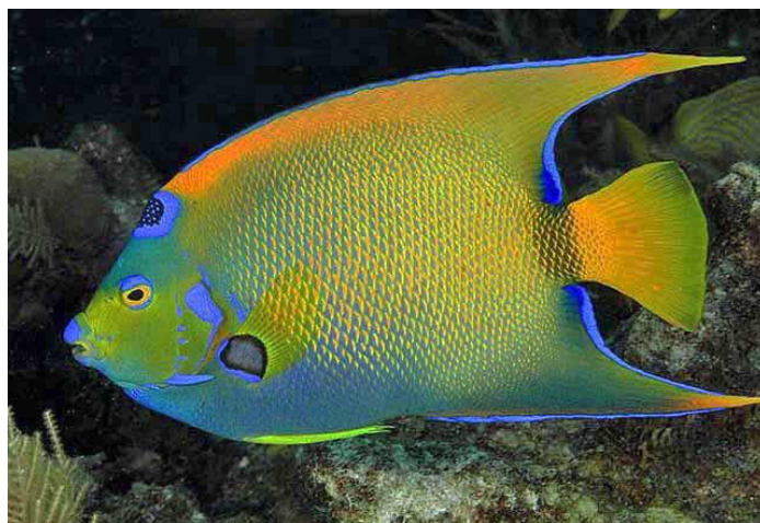
Slika 19. Kraljičin anđelak ( Holacanthus ciliaris )

Vrsta kraljičin anđelak iz porodice Pomacanthidae morski je nemigracijski stanovnik koraljnih grebena subtropskih i tropskih područja zapadnog i središnjeg Atlantika (Deidun i sur., 2020.). Prilagođena je životu među koraljima zahvaljujući bočnoj spljoštenosti. Agresivna je i teritorijalna, a obitava na dubinama od 1 do 70 m. Njezin izvorni areal proteže se od Bermuda, Floride i Meksičkog zaljeva na sjeveru do Brazila i St. Paul's Rocks na jugu. Do danas je zabilježena jedino kod Trogira na dubini od 14 m (Dulčić i Dragičević, 2013.; Dragičević i Dulčić, 2012.).