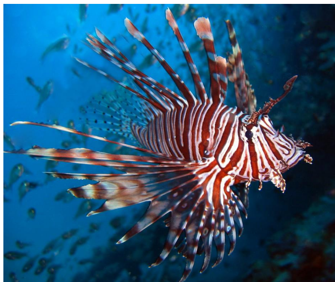
Slika 6. Riba kokot ( Pterois miles )