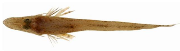
Slika 16. Patuljasti patkoglavac ( Elates ransonnettii )

Pridnena vrsta patuljasti patkoglavac pripada porodici Platycephalidae. Rasprostranjena je u Južnom kineskom moru, Tajlandskom zaljevu i u vodama Filipina do sjeverne Australije. Prisutna je na dubinama do 53 m te na pjeskovitim i muljevitim dnima. Prehrana ove vrste uključuje bentonske beskralježnjake i sitne ribe. U Jadranskom moru je prvi i jedini put zabilježena 2010. godine kod Kaštel Sućurca na 15 m dubine. U područjima gdje je autohtona ima veliki gospodarski značaj (Dulčić i Dragičević, 2011.; Dulčić i sur., 2010.).