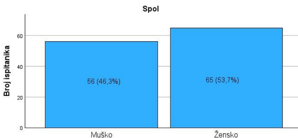
Slika 1. Prikaz broja ispitanika prema spolu

U istraživanju su sudjelovali nastavnici Tehničke kulture s područja Republike Hrvatske. Ukupan broj ispitanika iznosio je N=121 , od toga je 46,3% ( N = 56 ) muškog spola, a 53,7% ( N = 65 ) ženskog spola (Slika 1.).