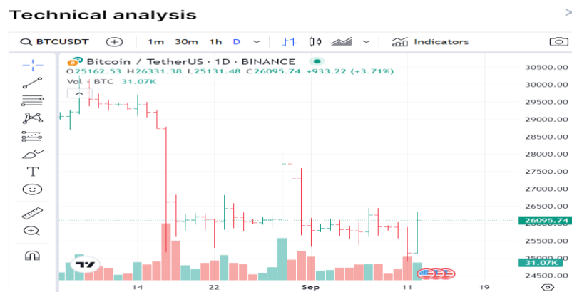
Slika 2. Stupčasti grafikon