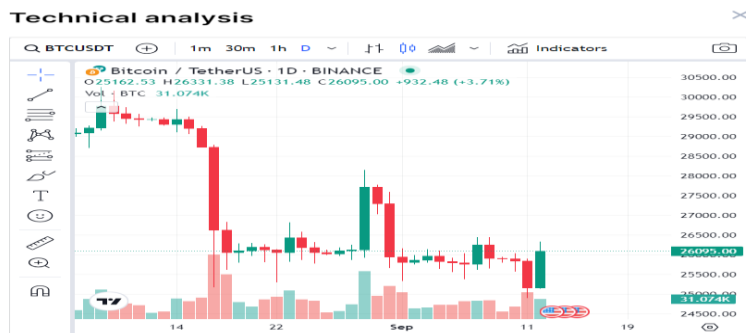
Slika 3. Grafikon s japanskim svijećama

Razine podrške i otpora ključni su pojmovi u tehničkoj analizi koji se koriste za određivanje smjera kretanja cijene vrijednosnog papira. To su razine na grafikonu cijena gdje se susreću ponuda i potražnja. Razina podrške je mjesto na grafikonu gdje cijena uglavnom prestaje padati. Što više puta cijena dođe do razine podrške i prestane padati to će razina podrške biti jača. Razina otpora je mjesto na grafikonu gdje cijena uglavnom prestaje rasti i pada natrag. Kada se probiju razine podrške i otpora, vjerojatno će se uspostaviti nove razine podrške i otpora. ( https://www.agrambrokeri.hr/UserDocsImages/Arhiva/UserDocsImages/publikacije/Uvod_u_tehnicku_analizu.pdf )