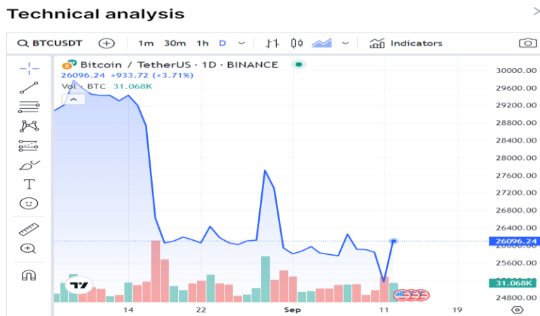
Slika 1. Linijski grafikon

odluke o kupnji ili prodaji. Najpoznatije vrste grafikona su linijski grafikon, stupčasti grafikon te grafikon s japanskim svijećama. Tehnička analiza prepoznaje različite obrasce koji se javljaju u kretanju cijena. Obrasci, poput trokuta, zastave, glava i ramena, mogu ukazivati na buduće promjene u cijenama. Analitičari koriste ove obrasce kako bi predvidjeli buduće kretanje cijena. ( https://financijskiimpuls.org/2017/01/15/tehnicka-analiza-analiza-kretanja-cijena-financijskih-instrumenata/ )