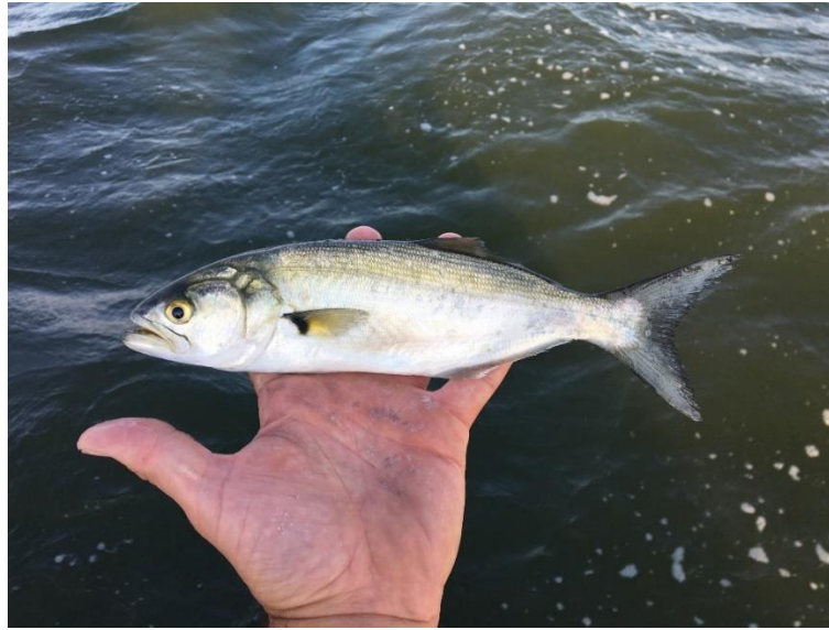
Slika 10. Strijelka skakuša ( Pomatomus saltatrix )

jedan od mogućih načina je lov u većim količinama i uvođenje u gastronomiju (Dulčić i Dragičević, 2011.; Dulčić i sur., 2005.).