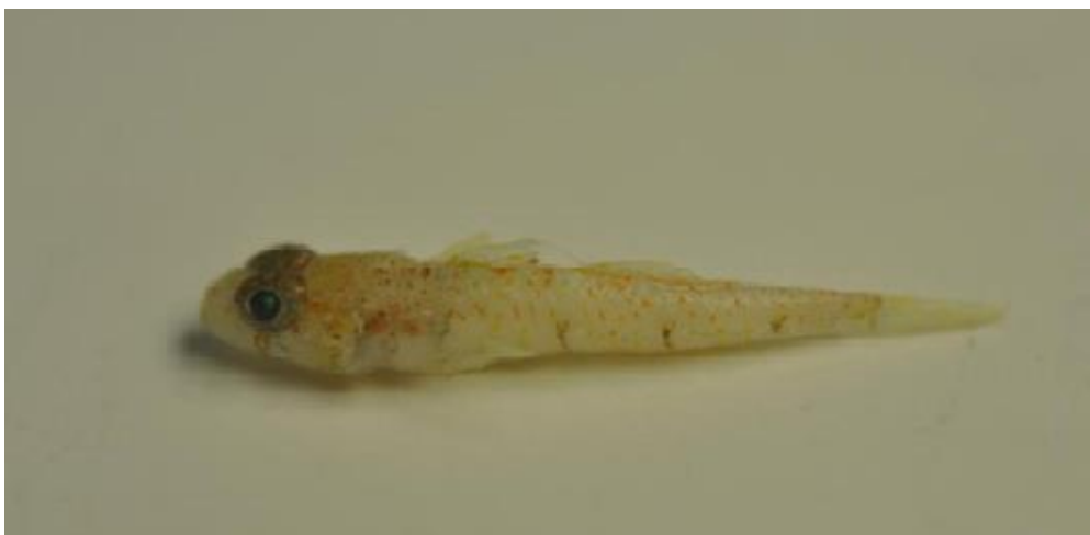
Slika 12. Buenia massutii (Autor: Marcelo Kovačić) (izvor: https://www.menorca.info/menorca/vivir-menorca/2017/04/26/1540676/descubren-nueva-especie-pez-menorca.html )