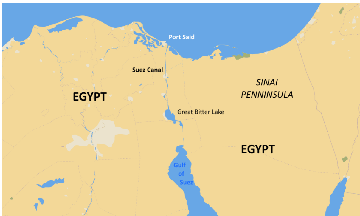
Slika 2. Prikaz geografskog položaja Sueskog kanala (izvor: https://narod.hr/kultura/video-17-studenoga-1869-sueski-kanal-7-cinjenica-koje-niste-znali-o-velikom-gradevinskom-pothvatu )